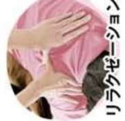
リラクゼーション ハンドマッサージ